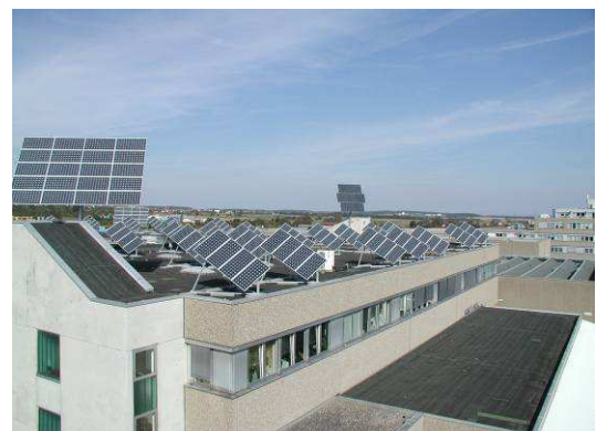
Einachsige- und zweiachsige- nach geführte Photovoltaikanlagen auf der Halle 4

Herstellkosten und Ertrag dieser Lösung liegen zwischen den fest montierten Anlagen und der WAP25 Version.