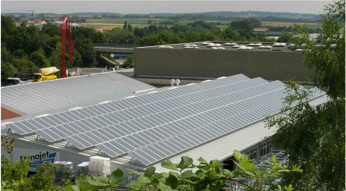
Halle 50- starre PV Anlage mit einer Gesamtleistung von 51,6kWp)

Das nächsten Bild zeigt die starren Anlagen mit einer Gesamtleistung von 51,6kWp auf der Halle 50