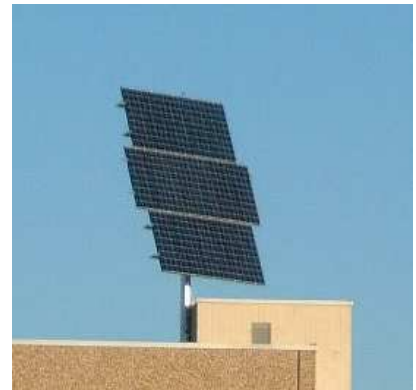
(Halle 4- WAP16 mit einer Leistung von 2 kWp)

Die KG - Firmenanteile der PSK liegen bei der Putzmeister Holding