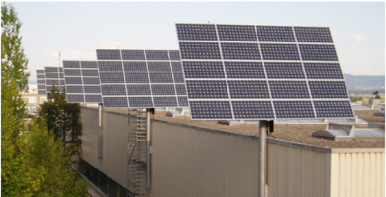
(Halle 6- WAP 25)

Im August 2004 wurden zunächst die hier im zweiten Bild gezeigten weiteren vier WAP 25 an der Nordseite der Halle 6 und zwei WAP 25 an Halle 4 mit einer Gesamtleistung von 21 kWp (6 x 3,5) montiert.