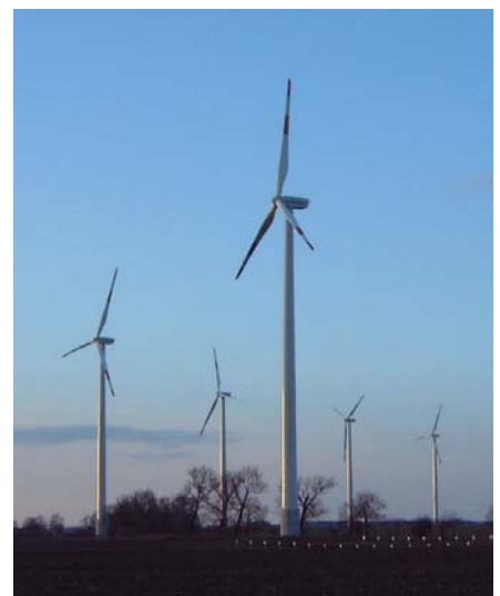
Oben die in Reihe senkrecht zur Haupt-Windrichtung stehenden K 6 – K10 mit 77 m Rotor auf 100 m NH – alle im flachen Gelände der Uckermark nördl. Prenzlau.

Oben Z 6 mit 77 m Rotor auf 100 m NH neben gleichen Maschinen der Z Reihe mit nur 70 m Rotor auf 65 m NH. (s.a. WC 02023 Steel and concrete towers side by side)